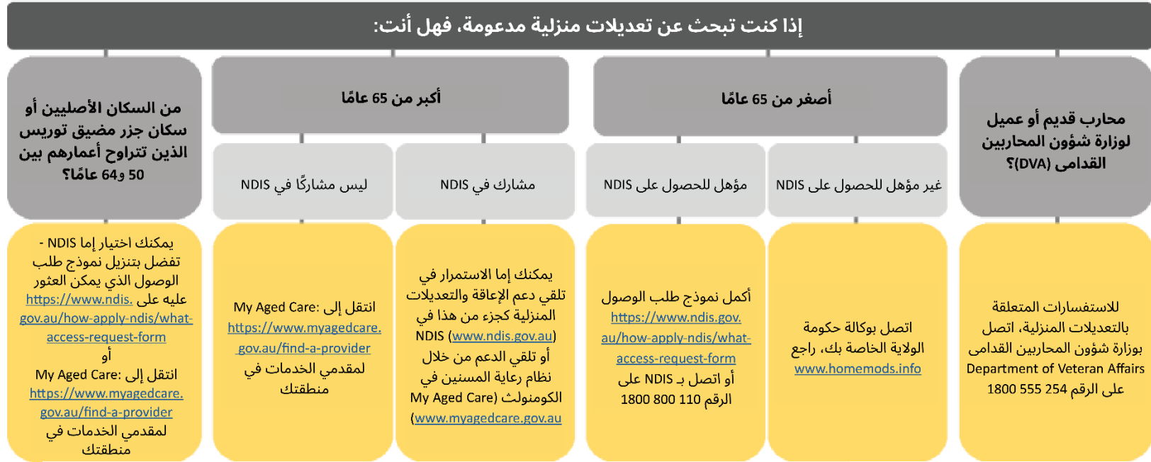
الشكل 1. دليل عام لترتيب التعديلات المنزلية